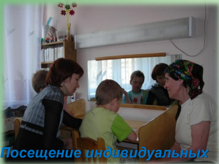
Посещение индивидуальных занятий